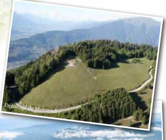
Décollage de Montendry