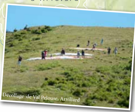
Décollage de Val Pelouse, Arvillard