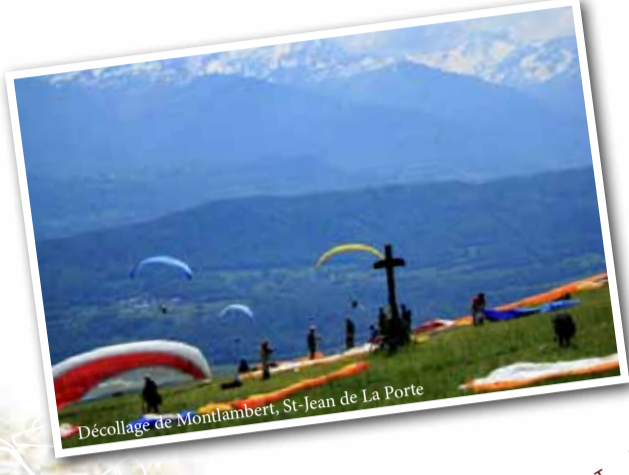
Décollage de Montfambert, St-Jean de La Porte