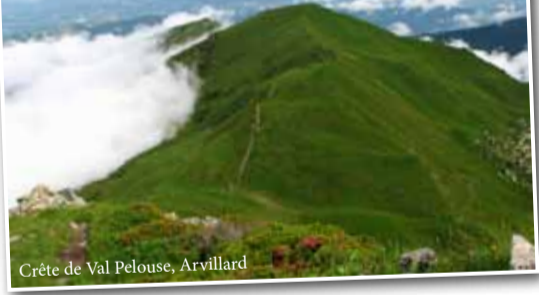
Crête de Val Pelouse, Arvillard